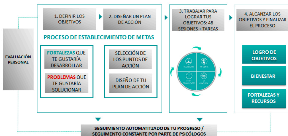
Esquema general del proceso de Coaching